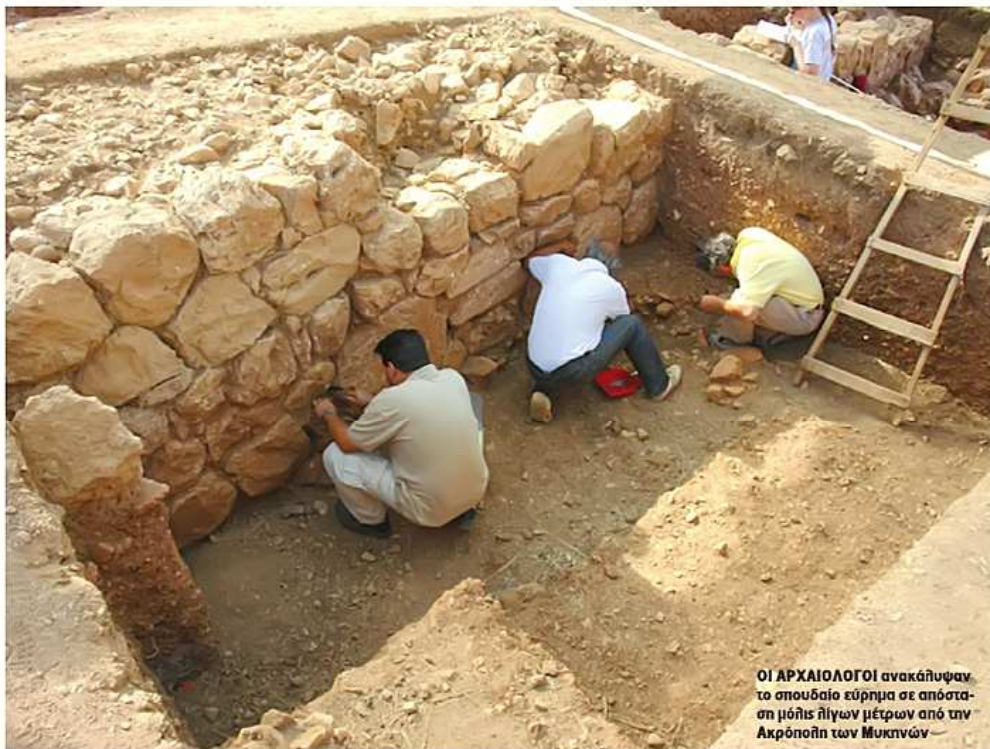
ΟΙ ΑΡΧΑΙΟΛΟΓΟΙ ανακάλυψαν το σπουδαίο εύρημα σε απόσταση μόλις λίγων μέτρων από την Ακρόπολη των Μυκηνών

και ποτάμιο». Εκτός όμως από τα πρώτα δεδομένα καταγραφής του ευρήματος, η αρχαιολογική έρευνα -διάρκειας ενός έτους- κατέληξε σε δύο στοιχεία που θεωρούνται καθοριστικά για την αξιολόγηση της ανακάλυψης. Πρώτον, θεωρείται βέβαιο ότι το κομμάτι του λίθου έχει λειανθεί προσεκτικά από τους τεχνίτες της αρχαιότητας, ενώ το δεύτερο είναι ότι προσομοιάζει με τον περίφημο «θρόνο του Μίνωα» που βρίσκεται στο ανάκτορο της Κνωσού στην Κρήτη.