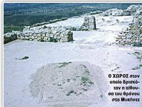
Ο ΧΑΒΟΣ στον οποίο βρισκόταν η αίθουσα του θρόνου στις Μυκίνες

Σύμφωνα με τη γραπτή ενημέρωση προς το υπουργείο Πολιτισμού, το εύρημα χαρακτηρίζεται ως «ευμέγεθες θραύσμα λίθινου ανηκείμενου, με εμφανή ίχνη κατεργασίας». Το ακριβές σημείο του εντοπισμού του, στην κοίτη του Χάβου, βρίσκεται σε απόσταση μόλις 80 μέτρων από την Ακρόπολη των Μυκηνών. Επιπλέον, όπως επισημαίνεται, το πείρωμα από το οποίο έχει κατασκευαστεί είναι «ντίπιο, φαίδρωμο