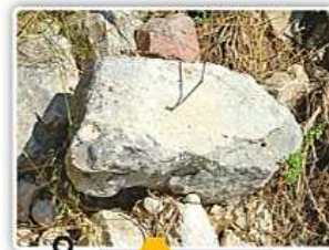
ΤΟ ΤΜΗΜΑ του θρόνου του Αγαμέμνονα που δέσποζε στην κεντρική αίθουσα του ανακτόρου των Μυκηνών