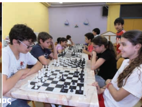
Φωτογραφίες από την προετοιμασία μας

Όπως κάθε χρόνο έτσι και φέτος ο Σύλλογος Γονέων του σχολείου μας με το τέλος της σχολικής χρονιάς θα οργανώσει εκδηλώσεις για τις δραστηριότητες που γίνονται όλο το χρόνο.