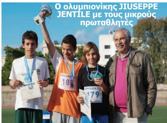
Ο ολυμπιονίκης GIUSEPPE JENTILE με τους μικρούς πρωταθλητές

Το Σάββατο 19 Μαΐου 2012 πραγματοποιήθηκαν στο Δημοτικό Γυμναστήριο Χαλανδρίου «Νίκος Πέρκιζας», Λ. Πεντέλης 150, Χαλάνδρι οι μαθητικοί αγώνες με την επωνυμία ΕΥΡΥΠΙΔΕΙΑ