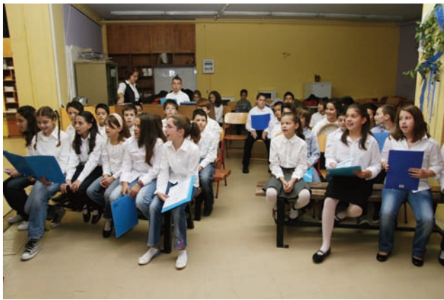
Τα παιδιά της χορωδίας της Ε τάξης

λευταία λόγια του Ιταλού ο Μεταξάς σηκώθηκε όρθιος .