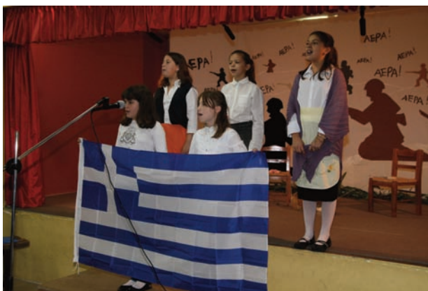
Δρώμενο από τα παιδιά της Ε2