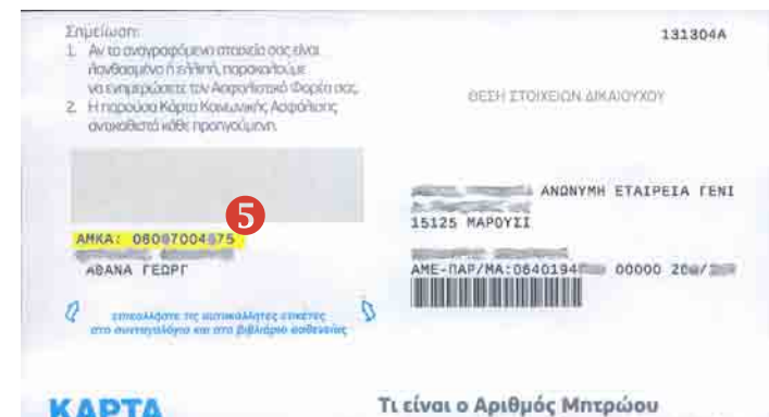
Επιστολή γνωστοποίησης ΑΜΚΑ