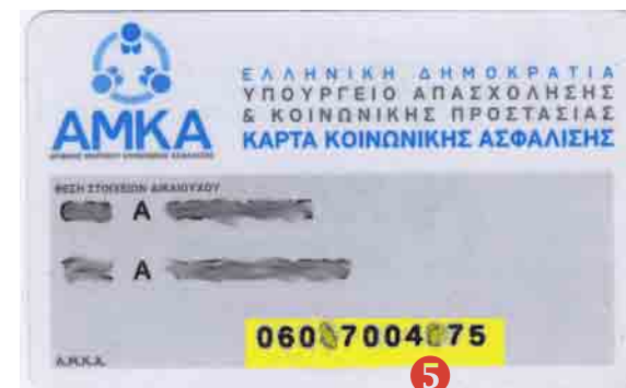
Κάρτα Κοινωνικής Ασφάλισης